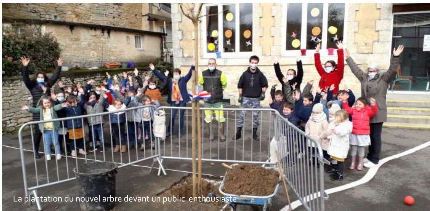
La plantation du nouvel arbre devant un public enthousiaste

un trop grand danger pour ne pas intervenir. Ce n'est donc pas sans émotion que nous avons tourné cette page d'histoire.