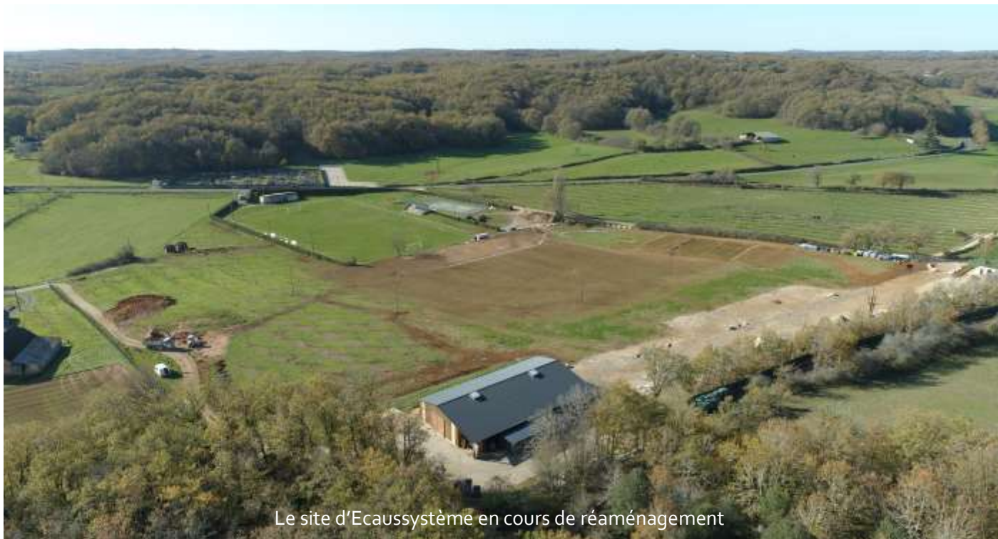
Le site d'Ecaussystème en cours de réaménagement

conditions idéales d'accès et de confort. A l'avenir, la partie noyeraie deviendra pour partie un espace dédié à la détente et à la restauration.